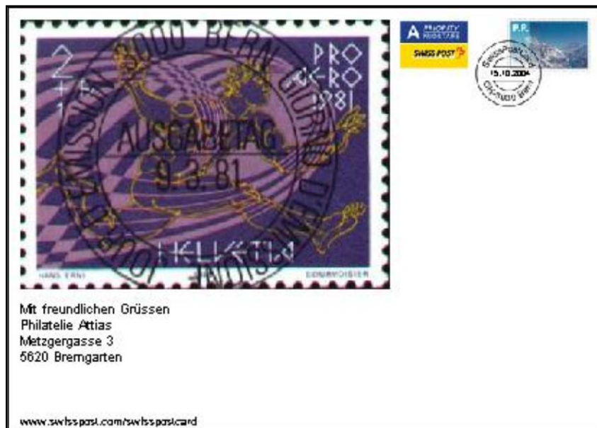
Vorderseite Karte C5 (A04-GS03)

Diese Ganzsachen wurden ohne jegliche Vorankündigen veröffentlicht. Die Karten sind an uns adressiert und mit Ankunftsstempel versehen. Wir haben schnell reagiert und können folgende Frühdaten offerieren: