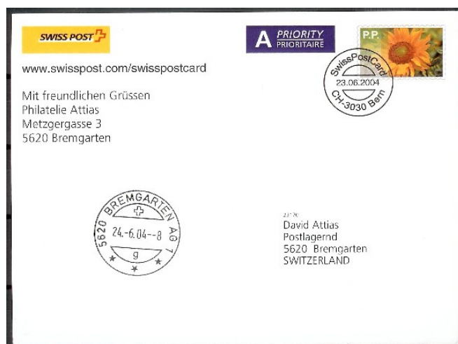
Karte C6 mit Sommermarke A04-GS02