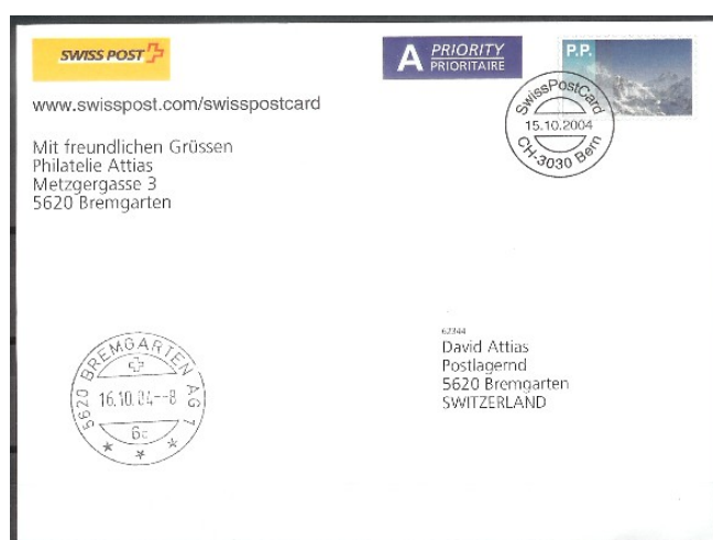
Karte C6 mit Wintermarke A04-GS04